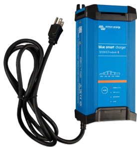
Blue Smart IP22 12/30 (3)