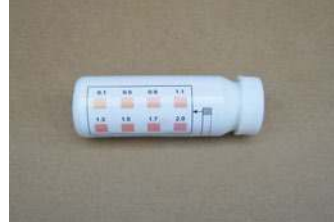
Las tiras de prueba