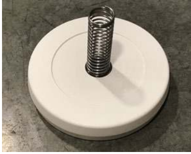
Unidad con resorte