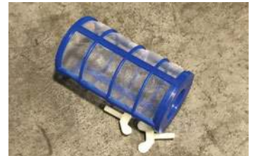
Malla protectora del anodo

Desenvuelva el paquete y saque todo su contenido. Recuerde que debe revisar bien dentro por si quedan piezas sueltas. Lea todas las instrucciones antes de proceder con el armado: