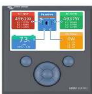
Color Control GX