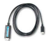
VE.Direct to USB interface