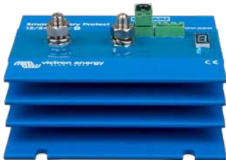
Smart BatteryProtect BP-220