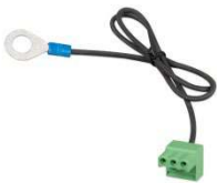
Conector con el cable negativo de CC preensamblado (incluido)

Protege la batería de las descargas excesivas y puede usarse como interruptor de encendido/apagado del sistema El Smart BatteryProtect desconecta las cargas no esenciales de la batería antes de que se descargue completamente (lo que dañaría la batería) o antes de que se quede sin la carga suficiente como para arrancar el motor. La entrada de encendido/apagado puede usarse como interruptor de encendido/apagado del sistema.