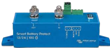
Smart BatteryProtect BP-100