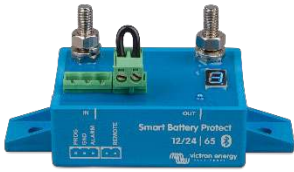
Smart BatteryProtect BP-65