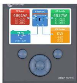
Color Control GX mostrando Una aplicación FV

Se puede acceder a los datos y cambiar los ajustes de los sistemas con Color Control GX u otros dispositivos GX si está conectado a Ethernet.