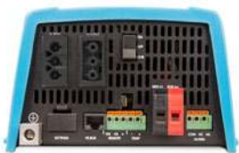
MultiPlus 500 / 800 / 1200 / 1600 VA