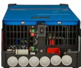
MultiPlus 2000 VA (sin la cubierta inferior)