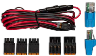
Accesorios incluidos con el Cerbo GX