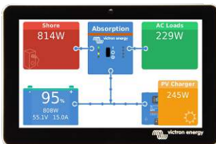
GX Touch 50 (pantalla opcional para Cerbo GX)