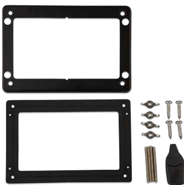
Accesorios incluidos con el GX Touch 50