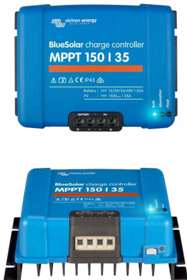
Controlador de carga solar MPPT 150/35