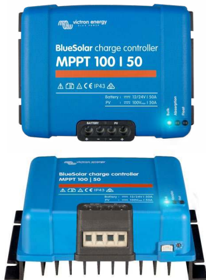
Controlador de carga solar MPPT 100/50